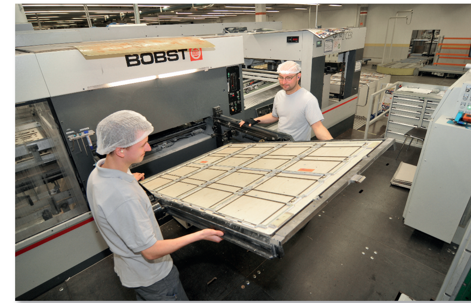
Wechsel einer Stanzform am Stanzautomaten

Medikamenteneinnahme einen großen Fortschritt brachte; sind die Ansprüche an heutige Verpackungen deutlich gestiegen. Sie muss das Produkt hauptsächlich vor Beschädigungen sowie Kontamination schützen und muss gut zu handhaben sein. Für den Transport in alle