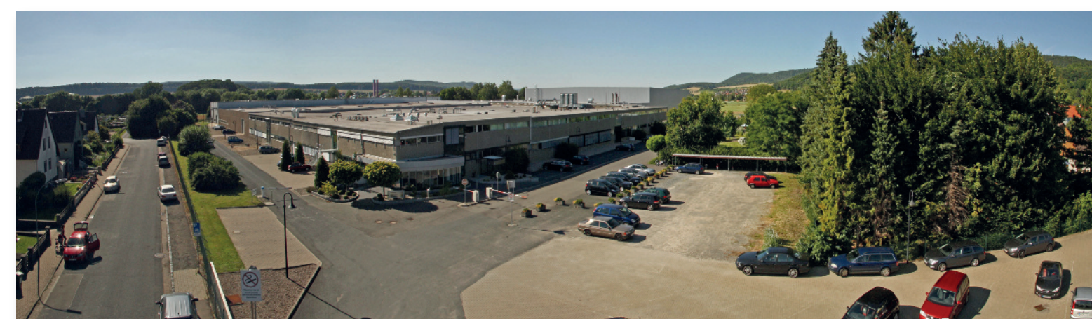
Panorama von Fritz-Kunke-Straße