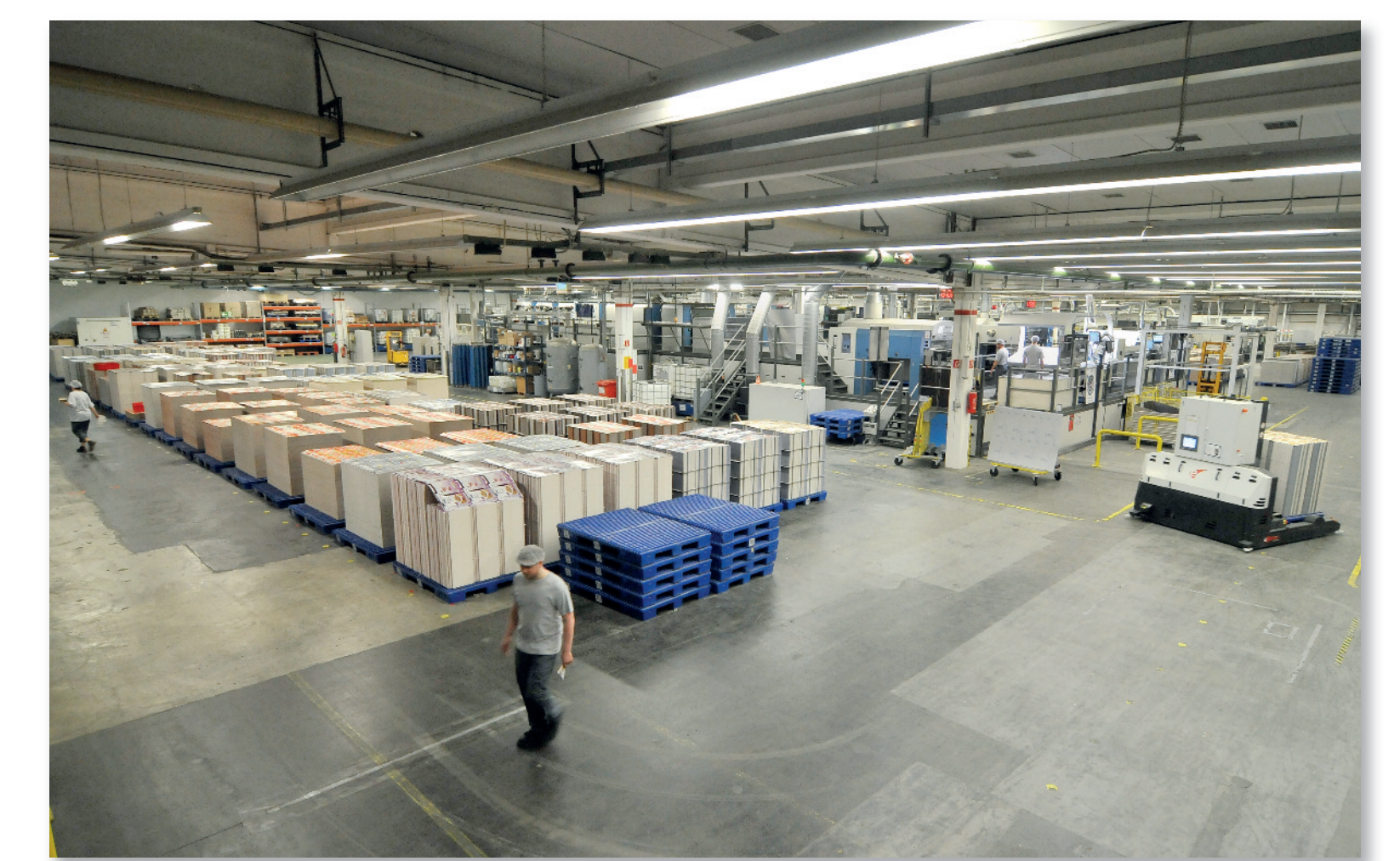
Blick in die Produktion

Welt muss ein Produkt darüber hinaus gut stapelbar sein und verschiedensten Belastungen standhalten. Ohne Verpackungen, wie wir sie heute kennen, wäre die industrielle Fertigung von Produkten nicht möglich. Besonders Lebensmittel können ohne geeignete Verpackung nicht gelagert, transportiert oder verkauft werden. Zusätzlich ist die Verpackung ein wichtiger Informationsgeber, z.B. zu Inhaltsstoffen sowie Gefahren- und Gebrauchshinweisen. Immer wichtiger werden zudem ein interessantes Design, ansprechende Farben und fehlerfreie Druckbilder sowie eine nachhaltige Produktion.