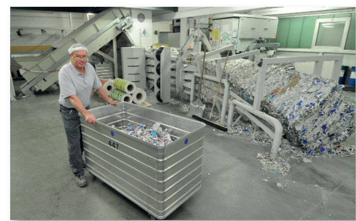
Recycling von Karton