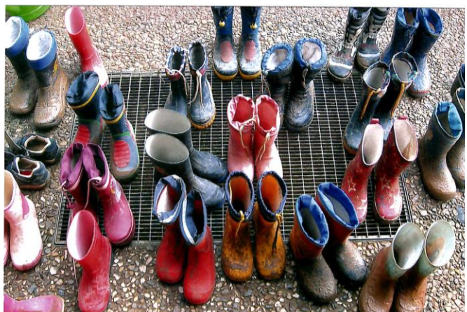
Konzeption | Kindertagesstätte "An den Steinköpfen", Stadt Alfeld (Leine)

(Auszüge aus der UN-Kinderrechtskonvention, leicht verständlich formuliert von Rosemarie Portmann. Aus: Rosemarie Portmann: Kinder haben Rechte. München: Don Bosco 2001, S. 8/9)